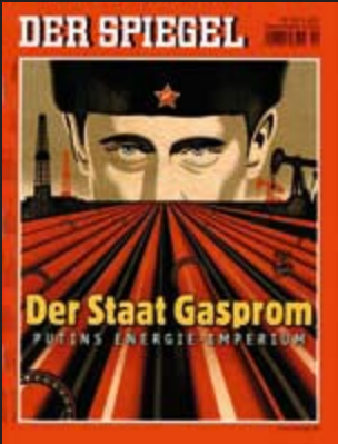
Titelbild der Zeitschrift »Der Spiegel«, Bundesrepublik Deutschland 2007 Deutsch-Russisches Museum

Im 19. Jahrhundert bewegte sich das Russlandbild der Deutschen wie kein anderes Fremdbild in einem extremen Spannungsfeld von Furcht und Faszination. Im 20. Jahrhundert setzte sich ein negatives Bild von Russland durch. Angst- und Feindbilder gewannen immer größeres Gewicht und führten in der Zeit des Nationalsozialismus zum Vernichtungskrieg gegen die Sowjetunion. ■ Dagegen hegte die russische Gesellschaft über Jahrhunderte vorwiegend Bewunderung und Neugierde für Deutschland. Erst die Bedrohung und reale Erfahrung im Zweiten Weltkrieg bewirkte, dass die Öffentlichkeit den Deutschen als Schreckbild wahrnahm. ■ Die zweite Hälfte des 20. Jahrhunderts war von einem langsamen Abbau der Konfrontation geprägt. Doch auch heute noch zeigen positive und negative Stereotype ihre nachhaltige Wirkung.