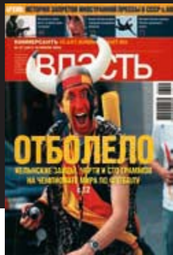
Titelbild der Zeitschrift »Vlast'« zur Fußballweltmeisterschaft in Deutsch- land, Russische Föderation 2006 Deutsch-Russisches Museum