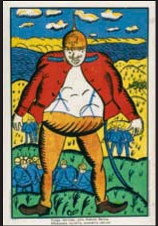
Plakat, Karikatur eines deutschen Soldaten, Russisches Reich 1914 Staatliches Historisches Museum Moskau