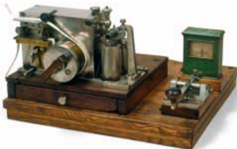
Telegrafenapparat der russischen Firma Siemens und Halske, Russisches Reich Ende 19. Jhd Staatliches Historisches Museum Moskau